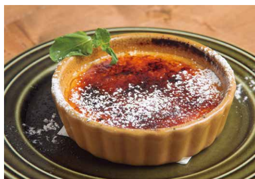
クレームブリュレ 500 Crème brûlée

オーダーが入ってから表面を焼き上げる、 パリパリ食感と濃厚なカスタードが絶妙です！