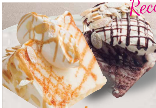
エンゼルフードケーキ キャラメル&ショコラ 600 Angel Food Cake Vanilla Caramel & Chocolate