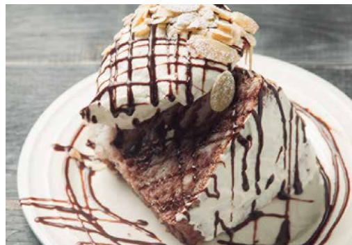
エンゼルフードケーキ ショコラ 500 Angel Food Cake Vanilla Chocolate

バニラ風味のしっとりモチモチのケーキ。 キャラメルソースが相性抜群の美味しさです！