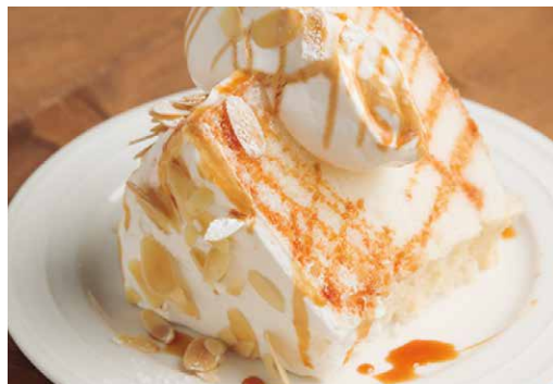
エンゼルフードケーキ バニラキャラメル 500 Angel Food Cake Vanilla Caramel

しっかり焼き上げたキャラメルのような味わいと 濃厚でクリーミーな大人のチーズケーキ！