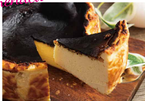
バスクチーズケーキ 630 Basque Cheese Cake

しっかり焼き上げたキャラメルのような味わいと 濃厚でクリーミーな大人のチーズケーキ！