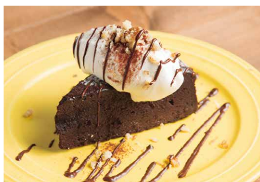
ガトーショコラ 580 Gâteau au chocolat

しっとりモチモチとしたショコラケーキ。 たっぷりのクリームとチョコレートソースで！